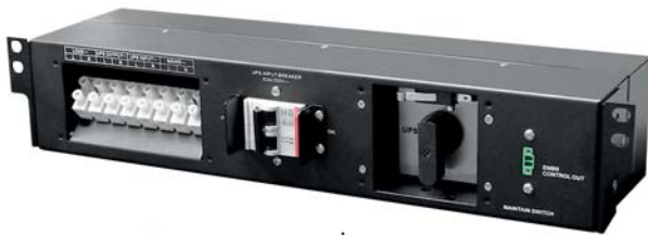
Conmutador de Bypass de mantenimiento