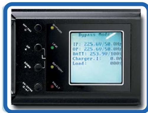
Display LCD Muestra voltajes de entrada, salida, tiempos de autonomía y carga de batería.